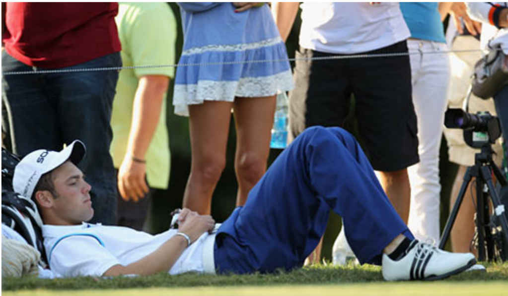
Martin Kaymer fuhr bereits 17 Turniersiege als Profi ein